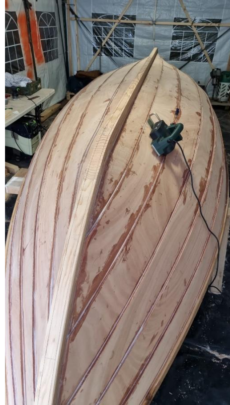
de Kus van Woerkum, NL022, voor de Skiffie Worlds in de vaart!