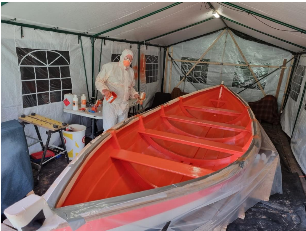
Spuiten van de demoskiff Flying Dutchman